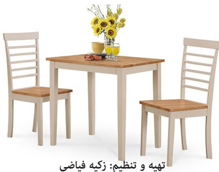
تهیه و تنظیم: زکیه فیاضی

پژوهشگران زحمت کشیده و در حیطه علوم انسانی. این کار طلاب را آسان تر می کند.