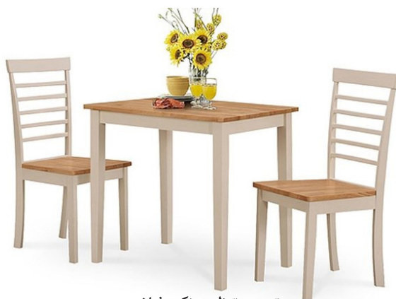
تهیه و تنظیم: زکيه فیاضی

عشق تحقیق نمود. اگر این شکلی باشد هر کاری که انجام دهیم ملکه ذهنمان می شود. از باب اینکه نمره ای کسب کنیم این مفید نیست. اغلب می بینم طلبه در عرض یک الی دو هفته و یا حتی الی ۴ روز تحقیق می نویسند و تحویل می دهد، این کار مفیدی نیست. این کار کپی، تقلید و نسخه برداری است.