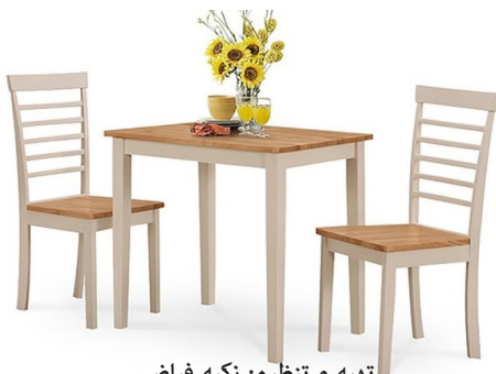
تهیه و تنظیم: زکیه فیاضی

اینگونه است که ما بتوانیم علوم گذشتگان را بگیریم و به حدی از مطالعه و تقوای علمی و قلبی رسیده باشیم که بتوانیم با فرمایشات قرآن کریم و اهل بیت - علیهم السلام - تطبیق بدهیم و فهم جدیدی که متناسب و موافق با آیات و روایات باشد بتوانیم به دست بیاوریم.